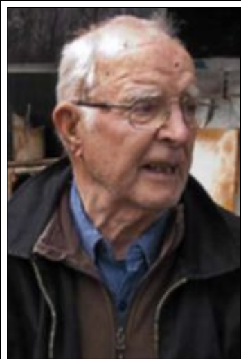
3 VLADIMIR KATRIUK, Kanada

■ Plutonchef i ett ukrainskt förband som mördade judar och andra civila i Vitryssland. Flydde till Kanada efter kriget, men förlorade sitt kanadensiska medborgarskap 1999 när hans nazistiska förflutna avslöjades. En domstol upphävde beslutet 2010.