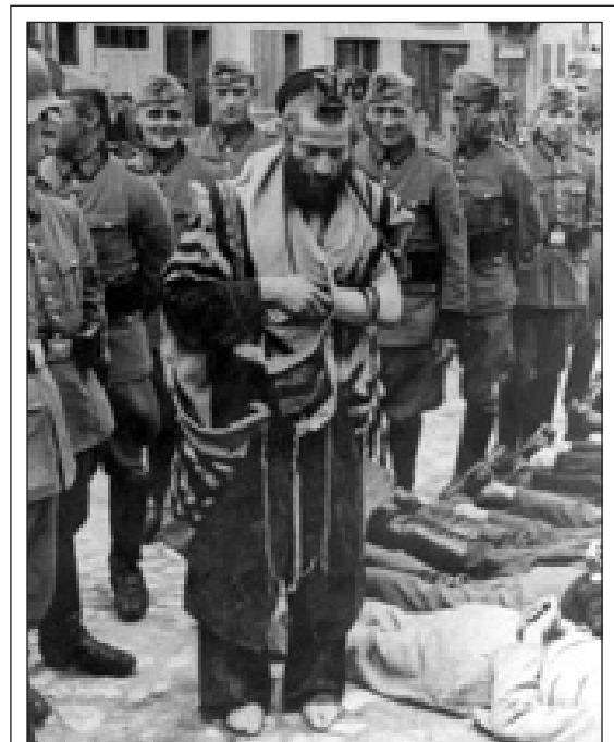
In Olkusz wurden die Juden nach dem Massaker vom 31. Juli 1940 öffentlich gedemütigt und misshandelt.

Der Grund für den geringen Erfolg und das völlige Desinteresse der Medien lag darin, dass die Polen sich im Allgemeinen nicht zu den Schuldigen im Holocaust zählen. Wenn überhaupt, sah sich die polnische Gesellschaft vielmehr selbst als Opfer der Nazis während des Zweiten Weltkriegs. Diese Haltung wurde neun Monate später, im Juni 2004, durch bekannte Persönlichkeiten des öffentlichen Lebens noch unterstrichen, als wir bekannt gaben, wir hätten eine kostenlose «Hotline» eingerichtet, um die Weiterleitung von Informationen betreffend polnische Verdächtige in Bezug auf die Ermordung von Juden zu erleichtern. Ironischerweise löste diese Ankündigung, und nicht die ursprüngliche Lancierung der «Operation: Letzte Chance», eine heftige Debatte darüber aus, ob unser Projekt in Polen überhaupt gerechtfertigt sei. Zu den Diskussionsteilnehmern gehörten auch einige Juden oder Polen jüdischer Abstammung in führenden Positionen, deren Einmischung nicht zufällig erfolgte. Unter