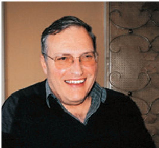
Dr. Efraim Zuroff.

denjenigen, die Ostatnia Szansa erbittert kritisierten, war z.B. auch Prof. Bronislaw Geremek, ein ehemaliger Aussenminister, der vor kurzem als Abgeordneter ins Europäische Parlament gewählt worden ist und dessen Grossvater, ein Rabbi, in Auschwitz ums Leben kam. In einem Radiointerview gab er seinen «grössten Abscheu» für dieses Projekt zum Ausdruck, das ihn angeblich «mit Ekel und Angst» erfüllte. Geremek zog es vor, «die ganze Welt über die vielen guten Taten der Polen [zur Rettung von Juden] zu informieren», und war daher «sehr überrascht» von unserer Initiative.