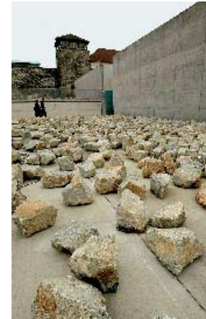
GEGEN DAS VERGESSEN Die Steinbrocken in der Gedenkstätte Mauthausen erinnern an die Zehntausende Opfer

Heute Sonntag ist Dr. Aribert Heim seit 16 432 Tagen untergetaucht. ●