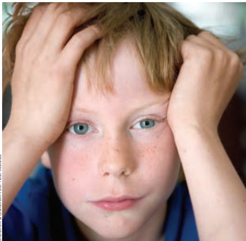
Granström & Granström