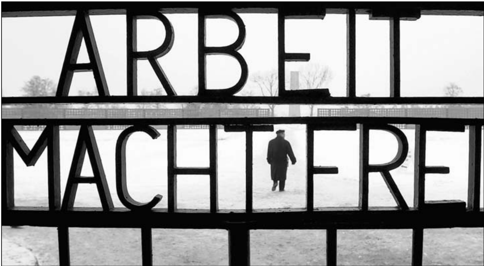
La Shoah (ici l'entrée du camp de Sachsenhausen) a coûté la vie de plus de cinq millions de juifs durant la Seconde Guerre. Certains de leurs meurtriers courent toujours...